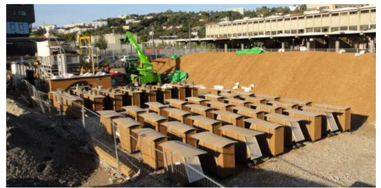
Aire de préfabrication des blocs pisé sur le chantier Ydeal Confluence. Fabrication Nicolas Meunier, entreprise « Le Pisé ». Crédit : Vergély architectes

La pertinence de ce matériau historique est ainsi accrue aujourd'hui, pour répondre aux situations caniculaires amenées à se reproduire plus fréquemment sur le territoire.